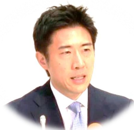
衆議院議員 塩崎 あきひさ 先生

国会 厚生労働委員会委員 財務金融委員会委員 政治倫理の確立及び公職選挙法改正に関する 特別委員会委員