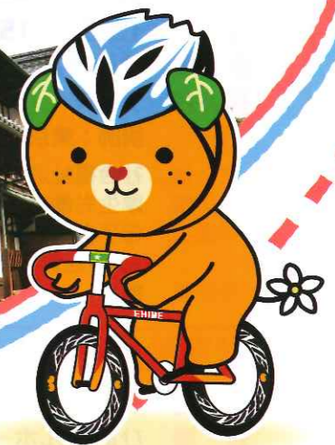
愛媛県イメージアップキャラクター みきやん